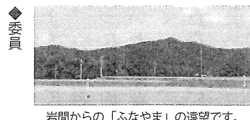
岩間からの「ふなやま」の遠望です。