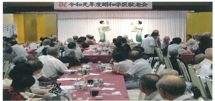
日本舞踊を見ながら