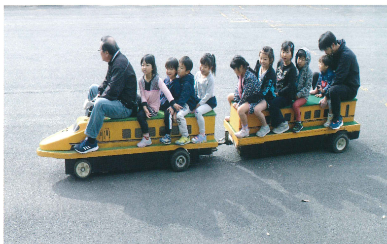
イエロードクターカー