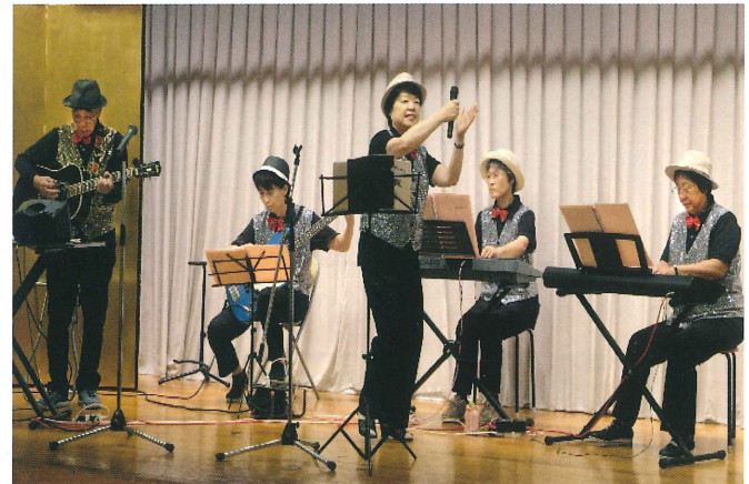
あの曲この曲 共に口ずさみましょう ♪