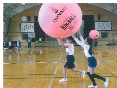
キンボールの準備運動