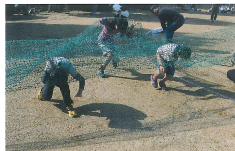
経験したことないよ～