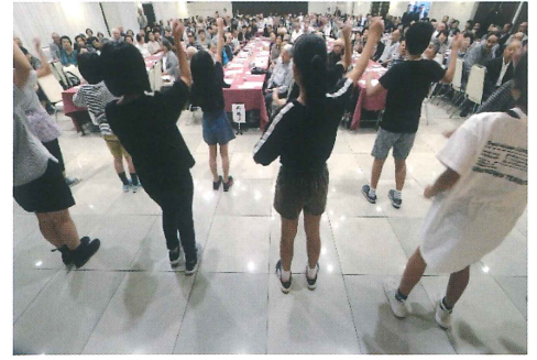
昭和小学校のみんな