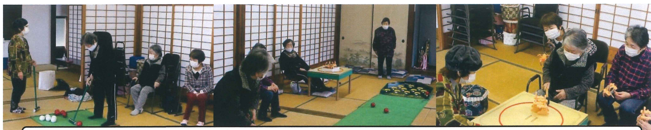
社協さんからゲームを借りて楽しんでいます。（スカットボール/太鼓相撲）10月24日

成和地域包括支援センター様による お話（ヒートショック・生活不活発病）と 簡単な体操とゲームの指導