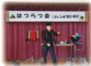
マジックショーや民踊を楽しみました