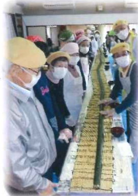
さらに長くなった 12.6mの巻きずしが完成♪