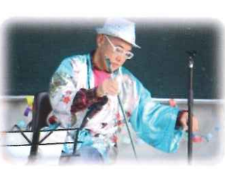
のこぎり・鼻笛演奏