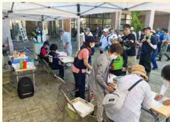
【災害ボランティアの受付】

災害ボランティアセンター運営にあたっては、福知山市民生児童委員連盟、赤十字レスキューチェーン京都 福知山支会、京都府市町村社会福祉協議会連合会をはじめ、多くの関係機関の皆様のご支援、ご協力をいただきました。また、運営費の支援や物資の提供、激励の言葉など、多くの皆様にお力添えをいただきました。心から感謝申し上げます。