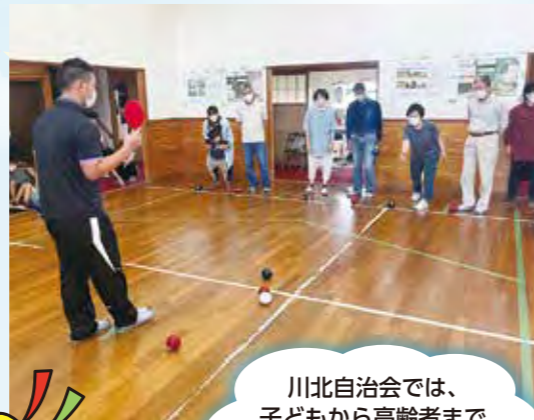
川北自治会では、子どもから高齢者まで一緒に楽しめました♪

重度の脳性まひ者や同程度の重度障害が四肢にある人のためにヨーロッパで考案されたスポーツです。ジャックボール（目標球）と呼ばれる白いボールに、赤・青のそれぞれ6球ずつのボールをいかに近づけるかを競います。相手のボールを弾くなど、様々な戦略があり、奥深く魅力的なスポーツです。障害の有無や年齢等に関わらず、全ての人と一緒に競い合い、夢中になれるスポーツとして注目されています。体験してみたいと思われる方は、お気軽に社協までご相談ください。