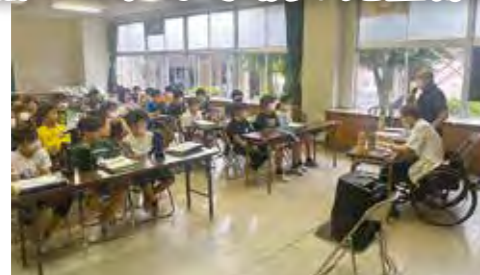
7/5(水) 昭和小学校「障害のある方のお話、車いす体験・ボッチャ体験」

社協では、小学校や児童館、放課後児童クラブ等で福祉学習出前講座を実施しています♪ 費用はかかりません。お気軽に社協までご相談ください!