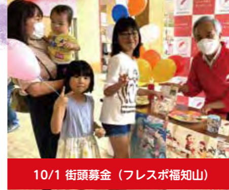
10/1 街頭募金 (フレスポ福知山)