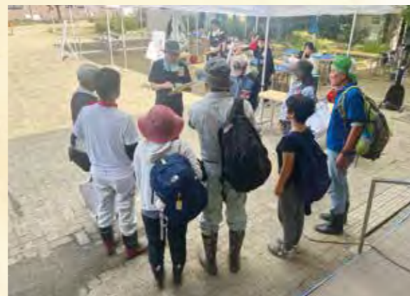
【グループに分かれて支援活動の打ち合わせ】