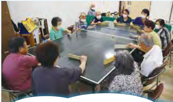
がんばろう会メンバーの方からは、「来るのが楽しみ」「仲間がいるから続いている」との声が。同会では、一緒に楽しむ仲間を募集されています！

30年以上続く福知山市身体障害者団体連合会卓球バレーチーム「がんばろう会」では、毎週土曜日の午後、総合福祉会館で社会参加と健康増進、チームワークを意識されながら練習に励まれています。令和5年度は、4回の大会に出場される予定です。