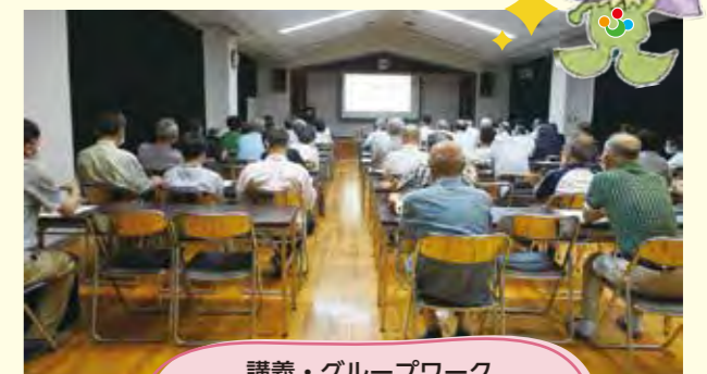
講義・グループワーク それぞれの形で研修されました♪