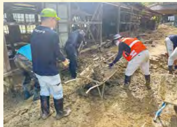
【家屋周りの泥の撤去】