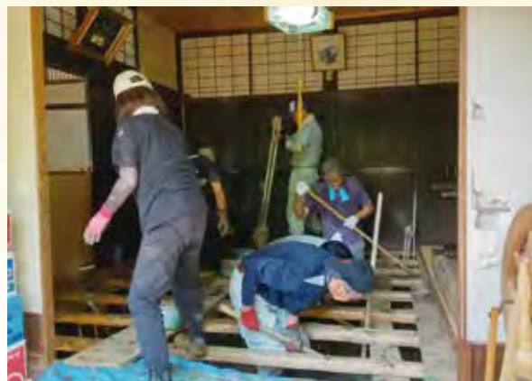
【床下の泥のかき出し】