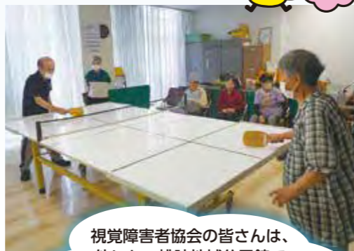
視覚障害者協会の皆さんは、他にも、桃映地域公民館でフライングディスクというパラスポーツを楽しんでいます！

福知山市視覚障害者協会では、毎週水曜日の午後、総合福祉会館で、健康づくりと交流、社会参加の機会として、練習会を実施されています。皆さんにとって貴重な運動や外出の機会となっているそうです。