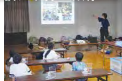
8/28(月) 上六人部放課後児童クラブ