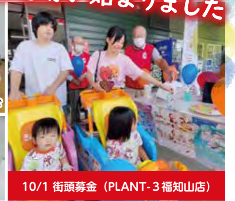
10/1 街頭募金 (PLANT-3 福知山店)