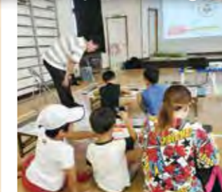
9/2(土) 南佳屋野児童館「ピクトグラムづくり」