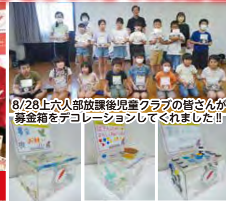
8/28上六人部放課後児童クラブの皆さんが募金箱をデコレーションしてくれました!!