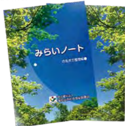
【1冊 300円 (税込)】

福知山市社協では、オリジナルのエンディングノート「みらいノート」を販売しています。最期まで、自分に正直な人生、生き方を送るためのツールとしてご活用ください。