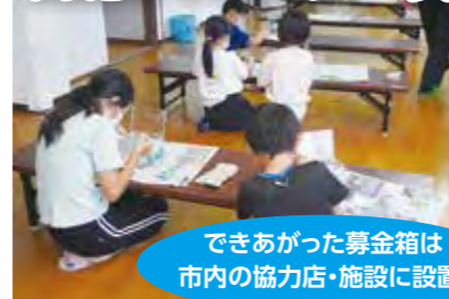
「赤い羽根共同募金箱づくり」