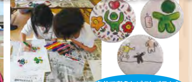
自分で考えたピクトグラムをマグネットにして贈呈!