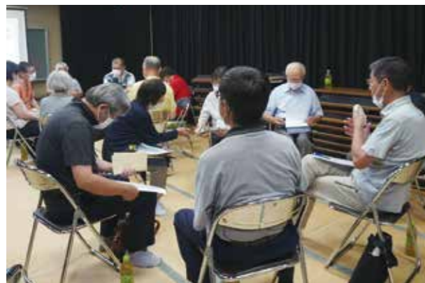
上豊富地区福祉推進協議会「福祉研修」

誰もが住み慣れた地域で暮らし続けることができるよう、各地域の課題などについて、一緒に話し合う場づくりを進め、各地域の福祉活動を支援します。