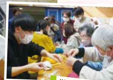
学生団体ちゃったのま 簡単あみもの体験