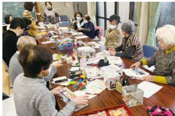
すみれ会（大池坂町）のサロン活動

高齢者や障害のある人、子育て中の親子等が交流し、地域での関係づくりや見守りにつながるサロン活動を支援します。