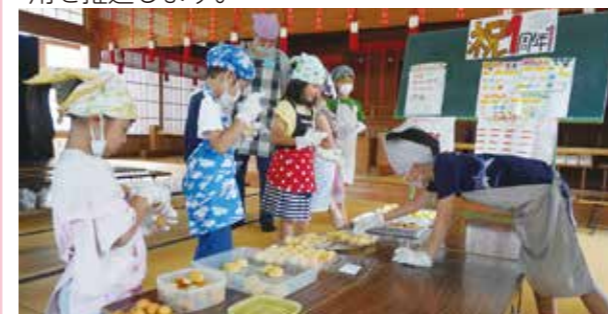
子ども食堂「昭和ぶんぶく食堂」