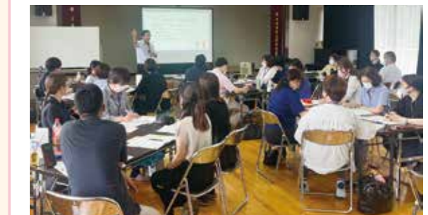
地域づくりを学ぶ研修会