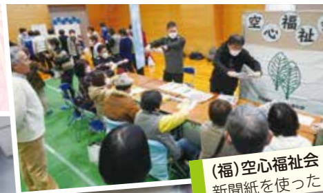
(福)空心福祉会 新聞紙を使ったレク