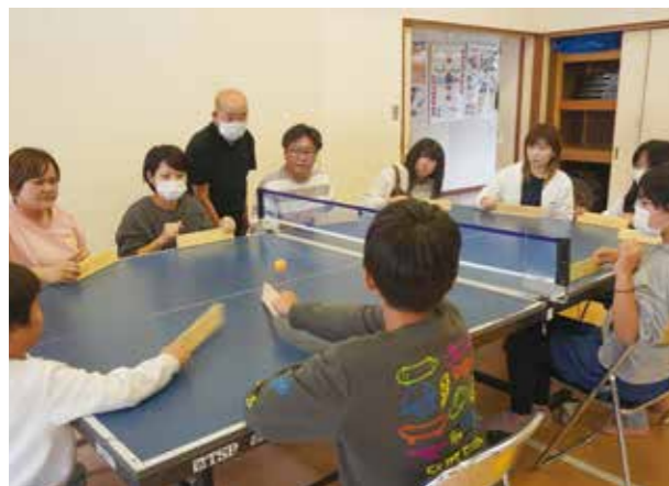
南佳屋野児童館卓球バレー体験

すべての世代や多様な立場の方が、交流や触れ合いを通じて福祉を学べる機会をつくります。