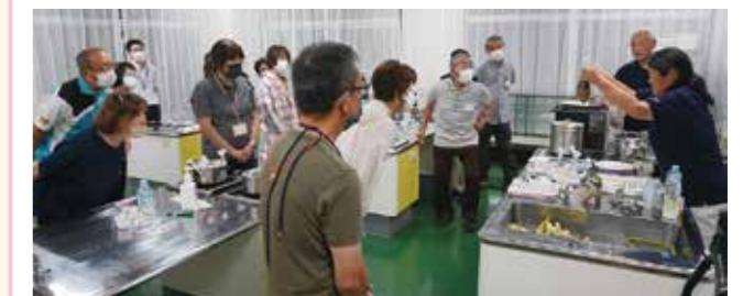
福知山市社協 防災ミニスクール

「防災」について学び合う機会を持ち、地域の防災力を高めるとともに、住民同士の繋がり、出会いのきっかけづくりを支援します。