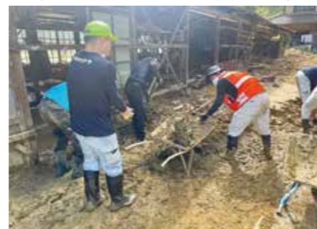
被災された方とボランティアのマッチング

平常時から災害ボランティアの活動を推進し、地域住民を主体とした防災・減災に向けた取組みの促進を図ります。非常時には災害ボランティアセンターを開設し、災害ボランティア活動を支援します。