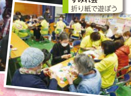
すみれ会 折り紙で遊ぼう

人と人が交流し、笑顔があふれる場には、多くのつながり(人と人との関係性)が生まれます。交流の場に、“楽しさ”と“ワクワク”と多様な体験を通じて、集まりの場を楽しくするための工夫を学び合うことを目的に、「福祉ふれあい万博～つながりのあふれる福知山へ～」を開催しました。