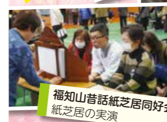
福知山昔話紙芝居同好会 紙芝居の実演