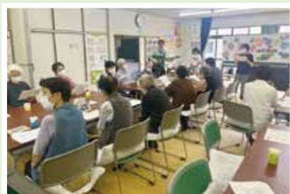
5/21(日) 平野会サロン サロン立ち上げ10周年をみんなで祝い♪