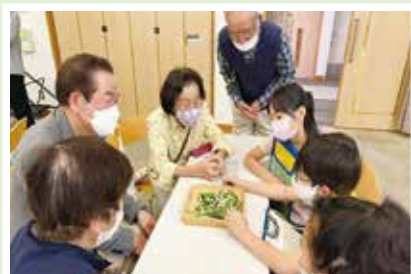
6/1(木) 千束いきいきサロンと 三和学園4年生との交流 “お蚕さん”を囲んで、笑顔いっぱいの交流会♪