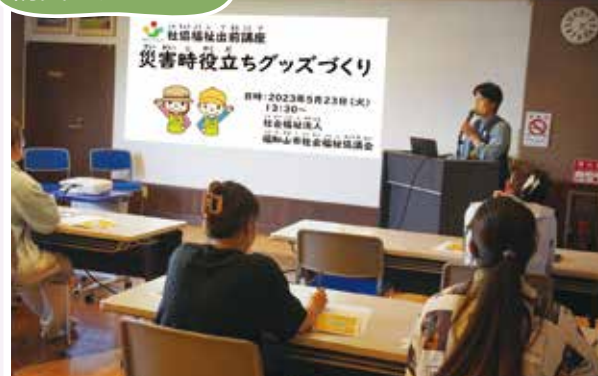
5/23(火) 空心福祉会の技能実習生の方向け防災講座 防災基礎知識(市)と、防災グッズづくり体験(社協)