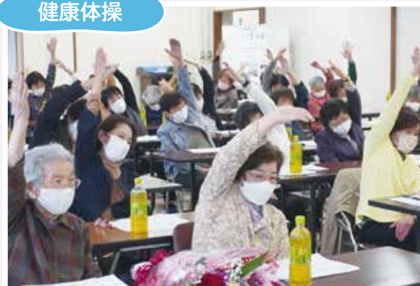
4/7(金) 介護ボランティアいずみ会 座ってできる いきいき筋トレ&脳トレ♪