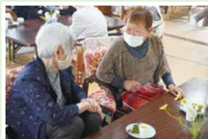
5/25(木) 畑中ふれあいサロン 手作りお菓子を食べながら 楽しく茶話会♪