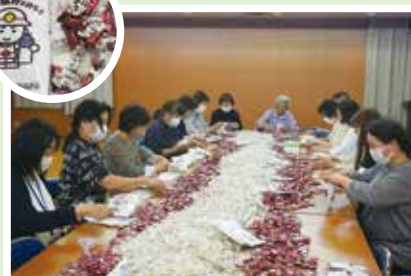
6/9(金) 桃映地区民生児童委員協議会 塩飴とチラシでひとり暮らし高齢者 世帯へ熱中症予防の訪問準備