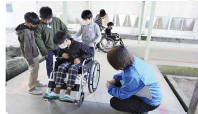
福祉出前講座 (福祉教育の推進) 市内小学校での車椅子体験

皆様からの会費は、住民同士のささえあいによる地域福祉活動推進のために、大切に使用させていただきました。ご協力いただき、誠にありがとうございました。