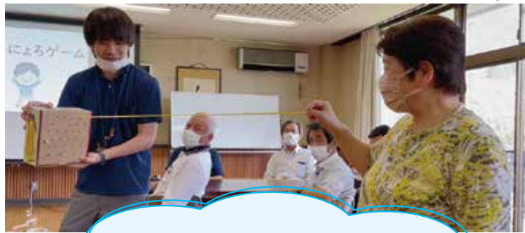
①引いたひもの長さを競う「にようにようゲーム」、 ②ボードの穴をねらって打つ「スカットボール」、 誰もが取り組めて、誰もが笑えるゲームです。(^^)

人と人との繋がり、元気の源…。今後、この体験を地域で広めていただき、楽しい“つどい”をとおして、たくさんの方が繋がる機会が増えるよう、社協としてもお力添えできたらと思います。