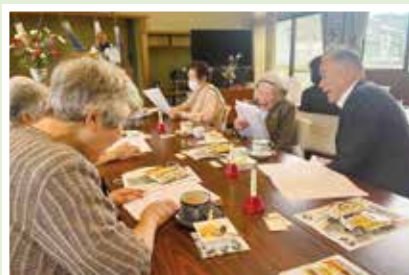
5/20(土) 観音寺サロン なごみ ハーモニカの素敵な演奏に合わせて熱唱♪