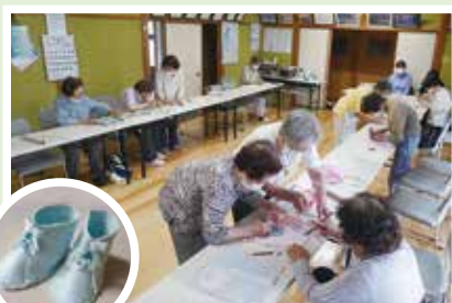
6/19(月) 福笑会 (口田野) 昭和・平成・令和と続く交流の場。 今回は粘土細工です♪