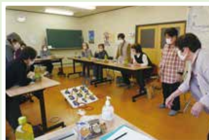
4/1(土) 内記6北サロン 集いでのを3年ぶりに再開！ 輪投げ&ワイワイおしゃべり♪