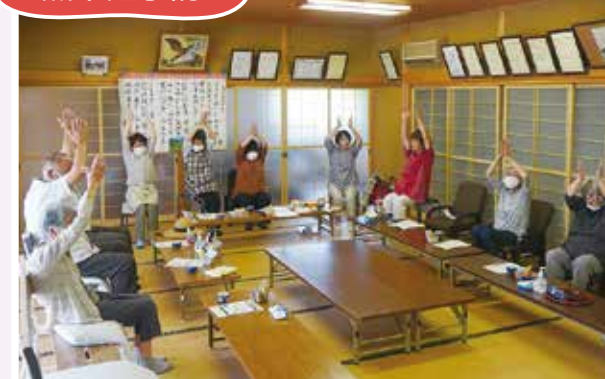
6/20(火) いきいきサロン しもぎ茶屋(下地) 熱中症に関するお話しと、予防のために 体操とゲームで心身の活性化