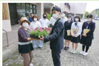
5/23(火) 大江高等学校 授業で育てたお花の苗を 地域に贈られました。