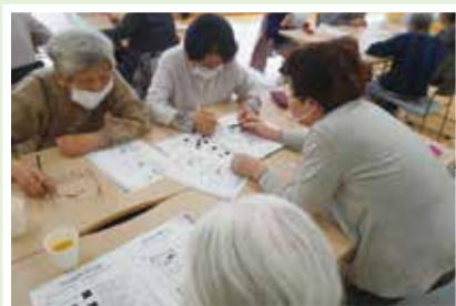
4/27(木) かしの木台いきいきサロン 楽しく脳トレ&貯筋体操！