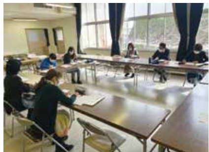
支援者もひとりじゃない... みんなで支える。

日ごろから、支援に関わる専門職同士が、顔の見える関係を育むことが、必ずより良い支援につながると信じています。