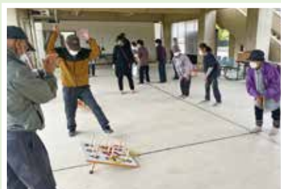
5/25(木) 戸田シルバー会 大盛り上がりの「ワナゲ大会」!