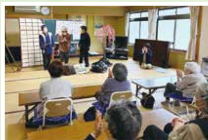
4/15(土) サロン「たんぼぼの会」(山中) 花見団子を食べ、寸劇「花咲爺さん」も 楽しめました♪