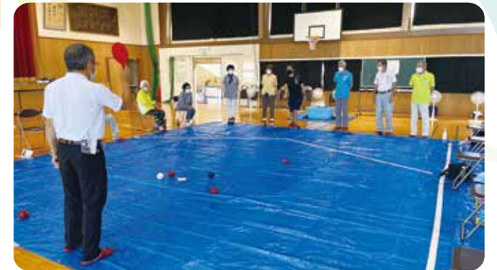
地域福祉活動推進の支援 成仁地区福祉推進協議会ボランティア交流会