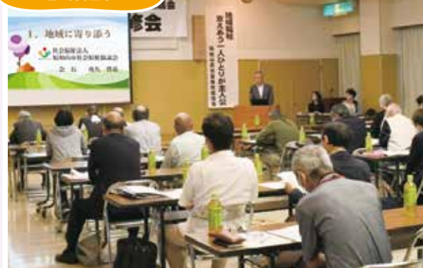
6/14(水) 昭和学校自治会長会・昭和学校民生児童委員協議会合同研修会 自治会長・民生児童委員の皆さんの交流の場で 社協の事業説明