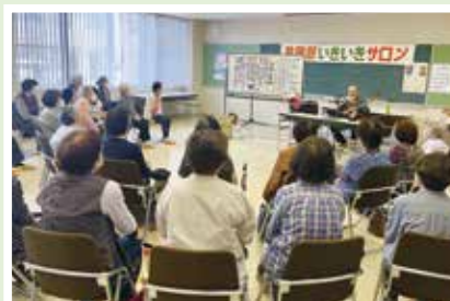
5/11(木) 前田区いきいきサロン 音楽で、みんながひとつになる 素敵な空間♪