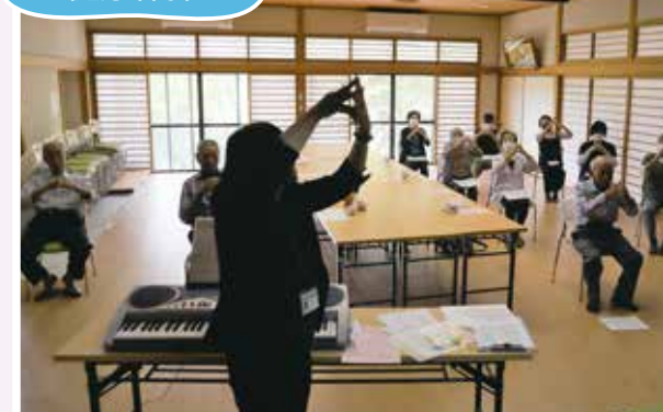
5/25(木) 中ふれあいサロン 懐かしい童謡や歌謡曲、脳トレで 声を出して歌って笑った楽しい時間