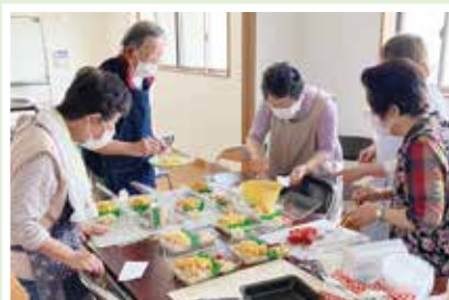
5/27(土) 岡ノ上ふれあいサロン ワイワイとみんなで作った ちらし寿司の味は、最高!!