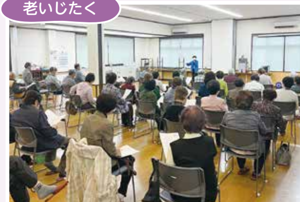
4/26(水) 石原老人クラブ 元気なうちから“老いたく”について考えよう♪