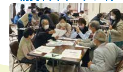
カードゲームで防災学習