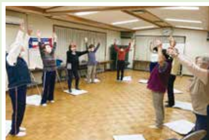
5/23(火) 本堀体操クラブ 一年を通じて楽しく健康体操!!