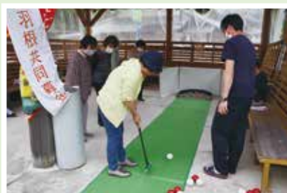
6/10(土) 雲原水車ひろばサロン みんながハマった! スカットボール!! 雲原ルールで楽しい時間♪